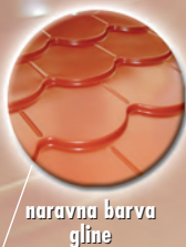
naravna barva gline