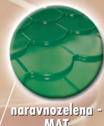
naravnozelena - MAT