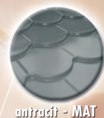
antracit - MAT